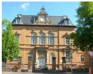
Gebäude: Hofgartenstr. 14