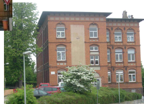
Gebäude: Hofgartenstr. 70